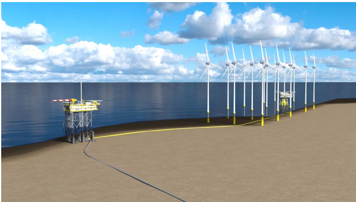
Visualisatie platform N05-A en aansluiting op offshore windpark Riffgat